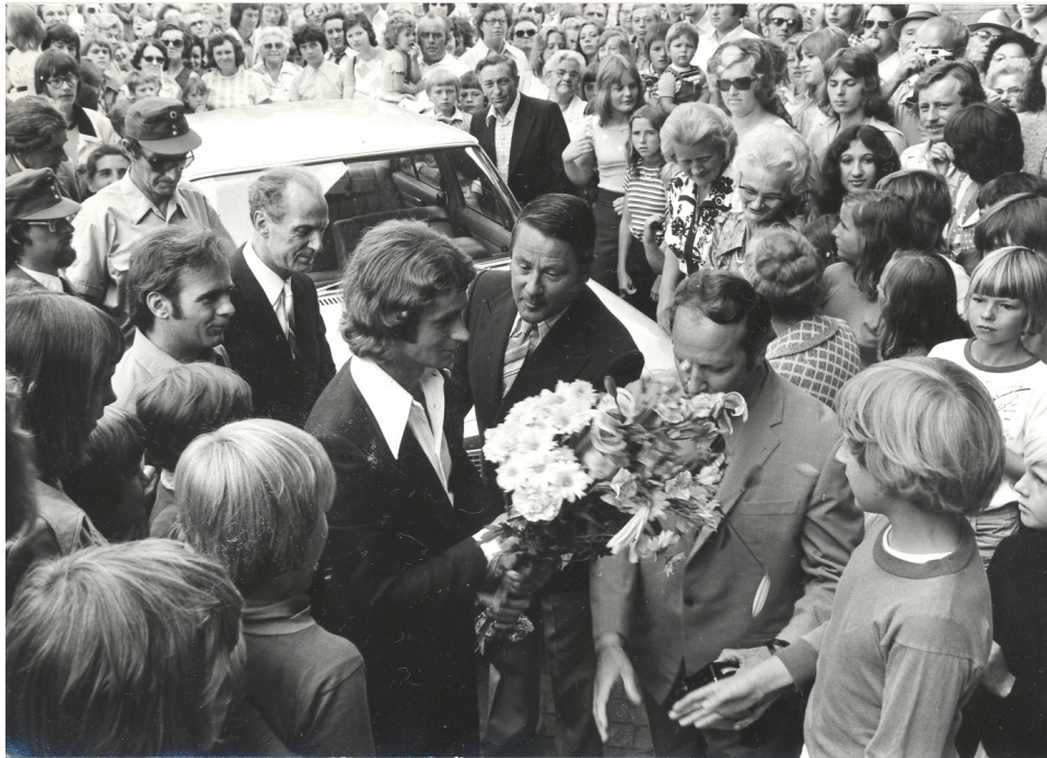
Abb. 3.: Empfang am Emmericher Rathaus

Rainer-Bonhof-Straße? Würde heute Jemand in Emmerich nach dem Weg zu dieser Straße fragen, würde er nur Kopfschütteln oder verwirrte Blicke ernten. Hätte ein Passant aber im Juli 1974 gefragt, hätten ihm vermutlich zahlreiche Fußballfans den Weg in die Gerhard-Cremer-Straße gewiesen.