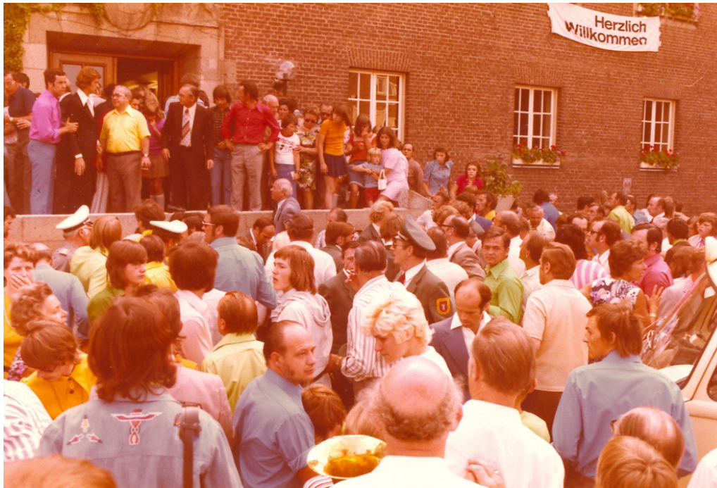
Abb. 5.: Empfang am Emmericher Rathaus