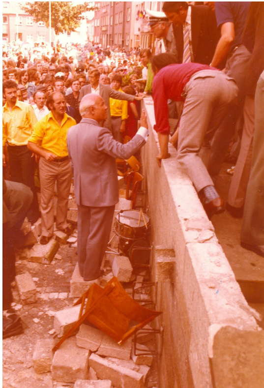
Abb. 6.: Die eingestürzte Treppe am Rathaus