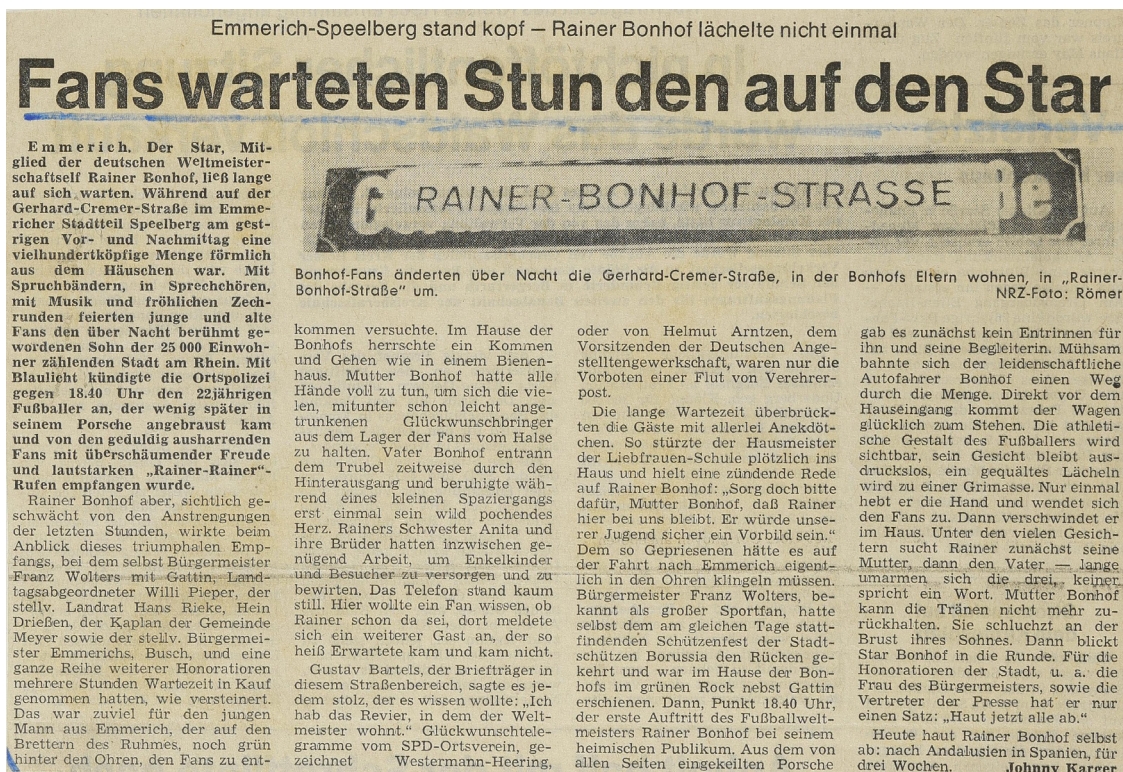
Abb. 2. Zeitungsartikel Rainer-Bonhof-Straße

Als die Nationalmannschaft schließlich den WM Titel holte, sollte dies schließlich der Höhepunkt von Rainers Karriere sein. Er gab die entscheidende Vorlage für das Tor von Gerd Müller, das schließlich den Sieg von 2:1 gegen die Niederländer besiegeln sollte. 8