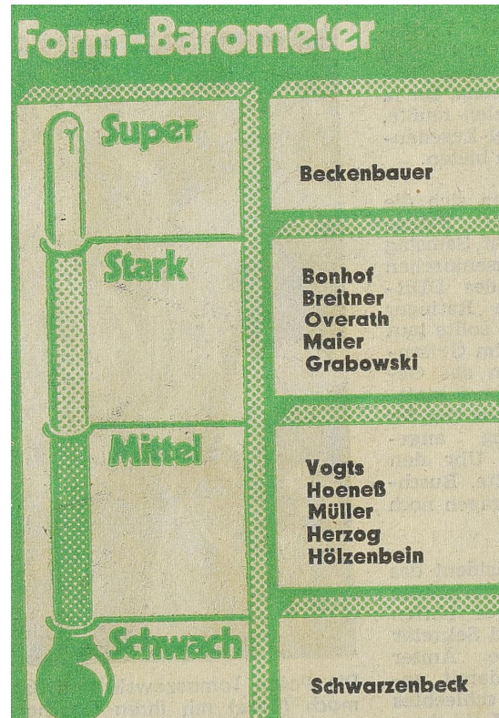
Abb. 1. Formbarometer im Zuge der WM 1974.