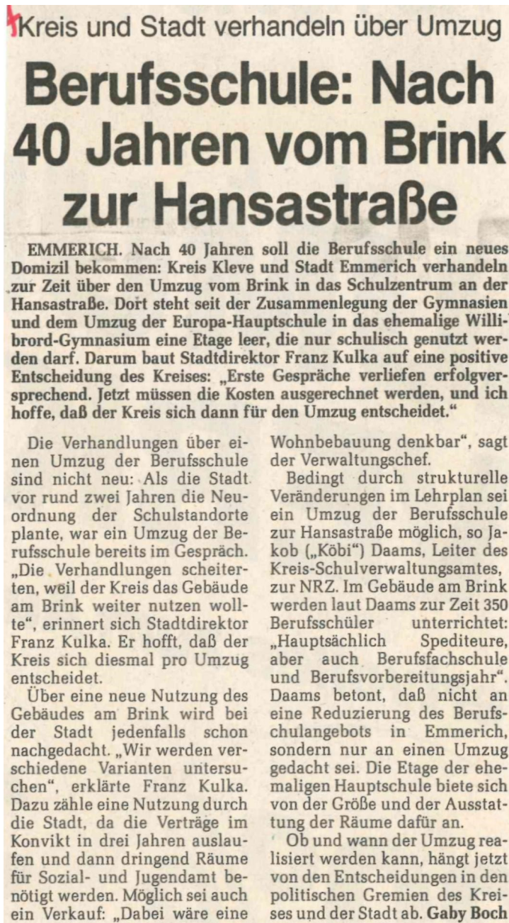
Abb. 2.: Zeitungsausschnitt aus: NRZ vom 29.04.1992.