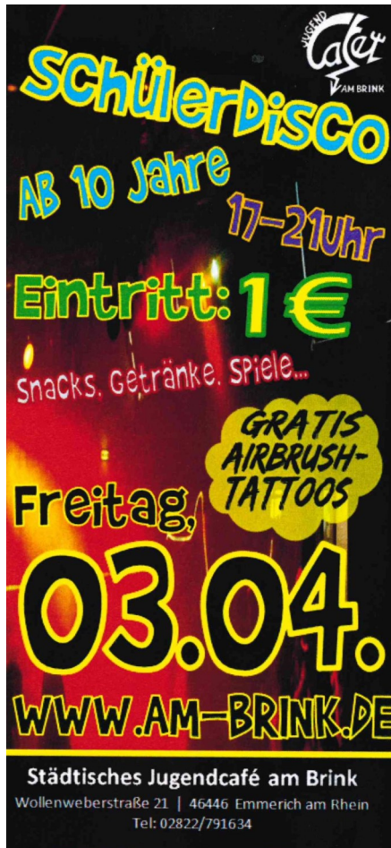
Abb. 3.: Flyer, 2004.

Neben den Freizeitangeboten ist das Jugendcafé auch eine Anlaufstelle für Kinder und Jugendliche, um Hilfe und Beratung bei persönlichen Problemen zu geben. Dafür steht eigens eine Sozialarbeiterin zur Verfügung, die Erfahrung in der Einzelfallhilfe hat. 8