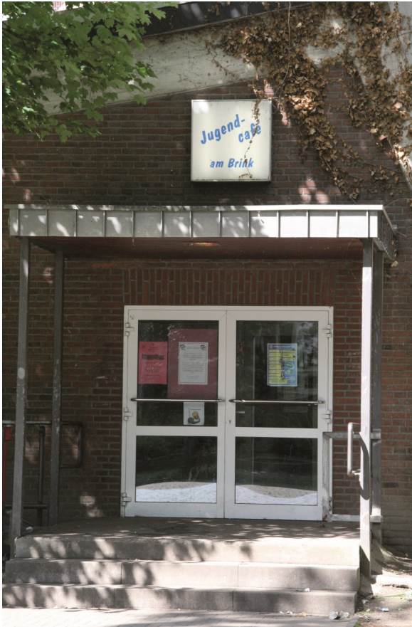
Abb. 1.: Das ehemalige Jugendcafé am Brink.

Am 22. Oktober 1998 wurde in Emmerich am Rhein das heutige Jugendcafé eröffnet. Nachdem im November 1997 die Entscheidung getroffen wurde das Konzept eines Kultur- und Jugendangebotes auf dem Lohmann-Gelände nicht weiterzuverfolgen, sollte schnell Ersatz gefunden werden. Dieser wurde in der alten Werkshalle der ehemaligen Berufsschule gefunden. 1 Das Konzept für das neue Jugendzentrum wurde im Januar 1998 vorgestellt. Die Pläne klingen nicht schlecht, trotzdem haben die Mitglieder der Musik- und Kulturinitiative Emmerich (MuKIE) Zukunftsängste.