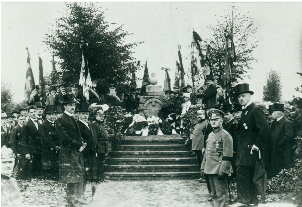
Abb. 4.: Kranzniederlegung 1923. Im Hintergrund eine Gesandtschaft des Kriegervereins, inklusive Fahnenträger.