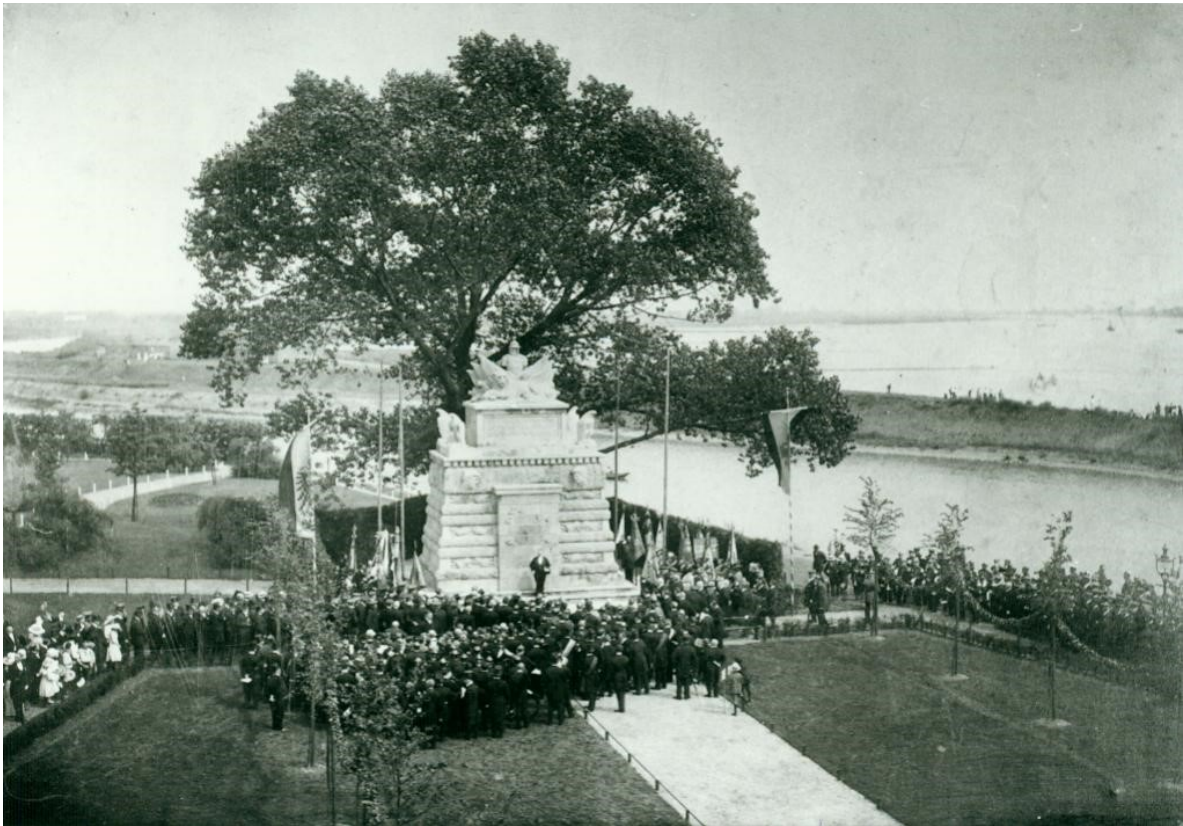
Abb. 3.: Einweihung des Kriegerdenkmals durch Bürgermeister Langen, 1913.