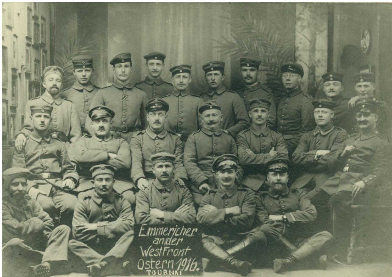
Abb. 1.: Gruppenfoto Emmericher Soldaten in Tournai, Belgien.

Wie viele Mitglieder der Verein zu seiner Gründung 1863 hatte, lässt sich nicht mehr nachweisen. Die ersten überlieferten Angaben vom 30. März 1867 sprachen jedoch von 50 Mitgliedern. 27 Jahre nach der Gründung waren es bereits 194 und weitere 25 Jahre später, im Jahr 1913, 324 Mitglieder. 3