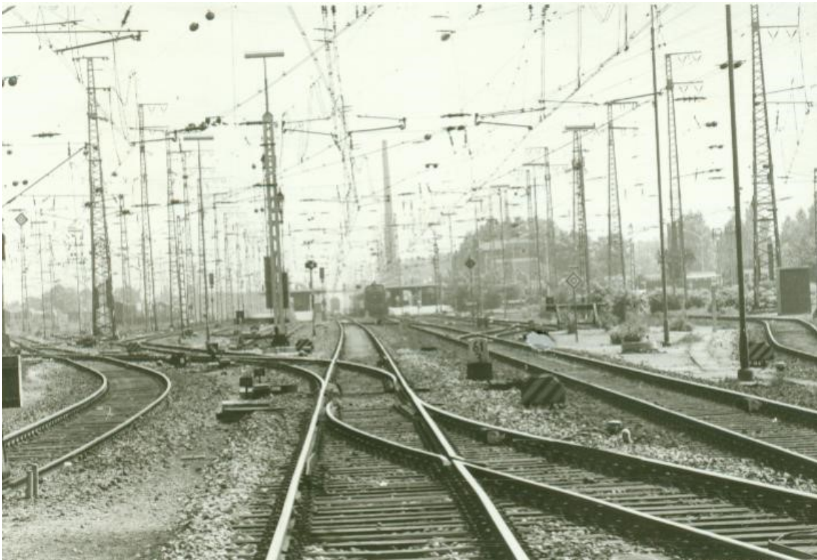
Abb.1.: Blick auf das Emmericher Bahngelände vom Löwentor aus, ca. 1976.

Als am 10. März 1973 eine Frau aus Oberhausen mit dem Zug nach Emmerich fuhr und währenddessen aus dem Fenster schaute, traute sie ihren Augen nicht. Zwischen Praest und Emmerich erblickte sie auf einem der Äcker eine männliche Leiche, die bis auf die Unterhose keine weitere Kleidung trug. Aufgeregt und verschreckt informierte sie nach ihrer Ankunft am Bahnhof die Emmericher Polizei über ihren Fund.